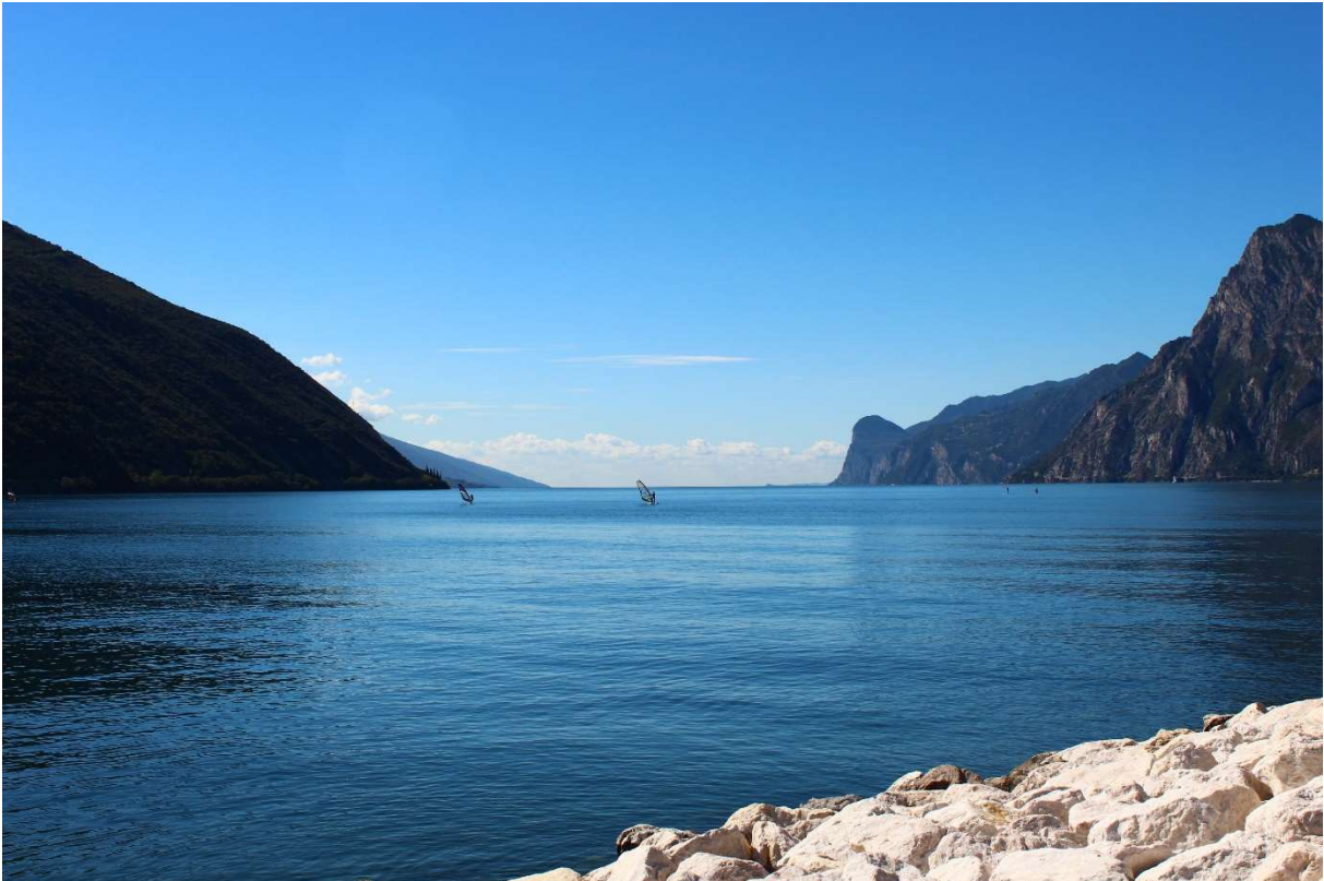
Lago di Garda